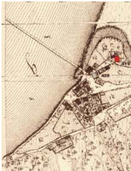
▲ Lage des Schiffmeisterhauses um 1828

Das Schiffmeisterhaus Deggendorf war ein Verkehrsknotenpunkt für die Donauschifffahrt. Von 1643 bis 1851 waren hier nachweislich Schiffmeister ansässig, die den Gütertransport auf der Donau organisierten. In dieser Zeit wurde in den Speicherräumen des Schiffmeisterhauses hauptsächlich Salz und Getreide gelagert.