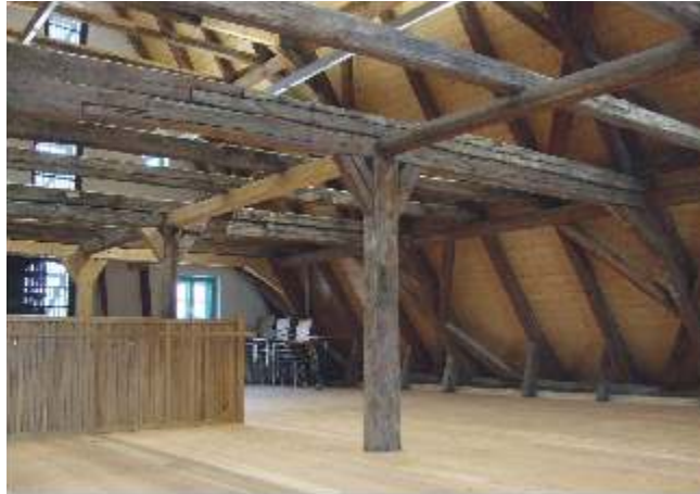
▲ Der historische Veranstaltungsraum

Seit 2008 dient es der Öffentlichkeit als Informations-, Ausstellungs- und Veranstaltungszentrum. Der Besucher findet hier neben der geschichtlichen Entwicklung des Hauses auch Informationen zu wechselnden Ausstellungen.