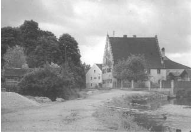
▲ Das Schiffmeisterhaus um 1920

Das denkmalgeschützte Schiffmeisterhaus ist eines der ältesten Bürgerhäuser Deggendorfs. Die Bausubstanz des Gebäudes reicht bis in das Mittelalter. Seine heutige Gestalt erhielt es im 18. Jahrhundert.