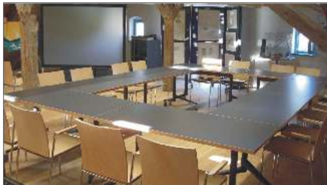
▲ Příklad zasedacího pořádku pro různé akce.

V podkrovním prostoru, kde byly ponechány původní trámy krovu, nabízíme pořádání kulturních akcí nebo seminářů. Kapacita sálu 70 osob. Nabízíme využití audiovizuálních medií, k dispozici jsou filmy, vizuální doprovod přednášek a bezplatný přístup na internet. Podrobnější informace k současným výstavám najdete na internetové adrese: www.schiffmeisterhaus.de