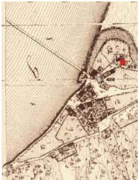
▲ Schiffmeisterhaus“ na mapě z roku 1828.

Budova „Schiffmeisterhaus“ byla centrem lodní dopravy na Dunaji. Je historicky doloženo, že od roku 1643 až do roku 1851, zde měli sídlo loďaři, kteří organizovali lodní dopravu zboží. V těchto letech se v půdních prostorách domu uskláděvala hlavně sůl a obilí.